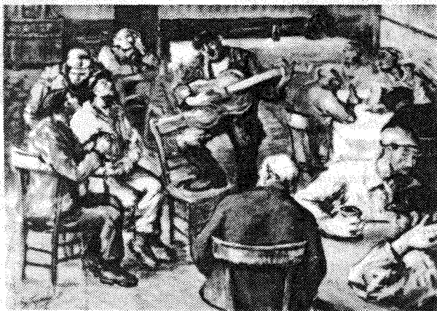
Il tempo libero (di S. Jemolo)

Nato nel 1927 a Comiso (Ragusa). Ha studiato presso l'Istituto d'Arte con Magistero e l'Accademia di Belle Arti. Vive e lavora a Carugo (Como).